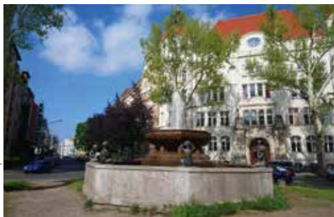
Der Barbarossaplatz in Schöneberg